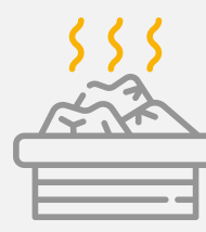
Sauna y Turco