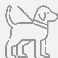
Zona de Mascotas